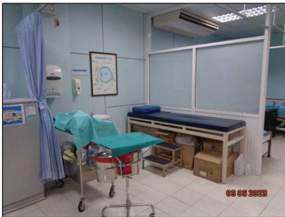
รูปที่ 3.28 อุปกรณ์ปฐมพยาบาล