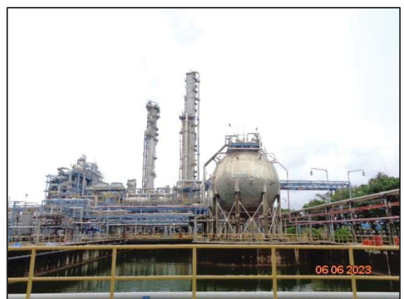
รูปที่ 3.13 คั่นกันบริเวณถังเอทิลีนออกไซด์