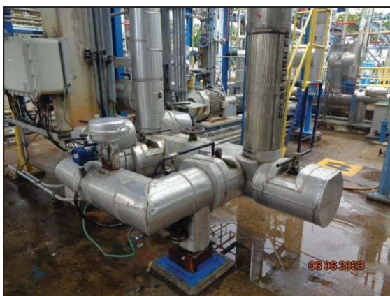
รูปที่ 3.36 ฉนวนหุ้มอุปกรณ์การผลิต เอทิลีนออกไซด์