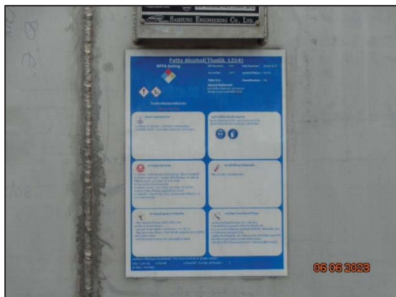
รูปที่ 3.32 ป้ายสัญลักษณ์แสดงความเป็นอันตราย ของสารเคมี (SDS)