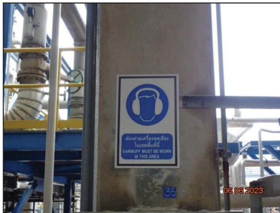
รูปที่ 3.16 ป้ายเตือนให้สวมใส่อุปกรณ์ลดเสียง