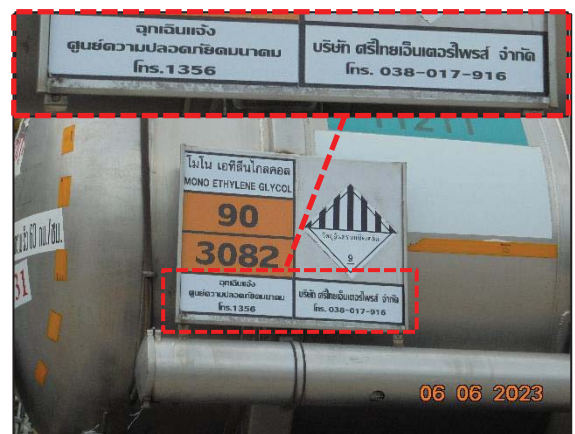
รูปที่ 3.19 ป้ายสารเคมี และเบอร์โทรศัพท์ฉุกเฉินส่ง