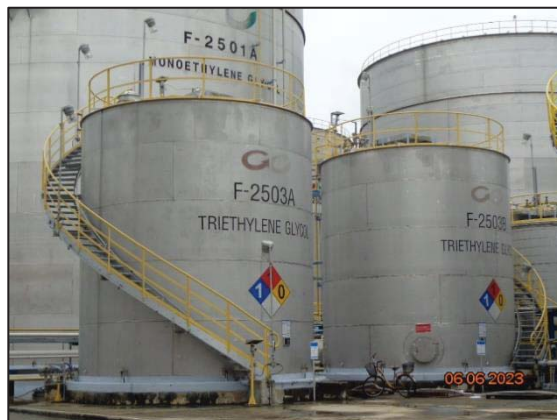
รูปที่ 3.33 ป้ายเตือนให้ทราบถึง ขอบเขตการเก็บสารเคมี