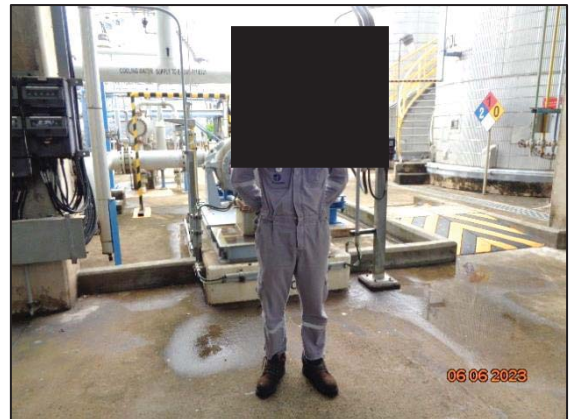
รูปที่ 3.15 พนักงานสวมใส่อุปกรณ์ คุ้มครองความปลอดภัยส่วนบุคคล