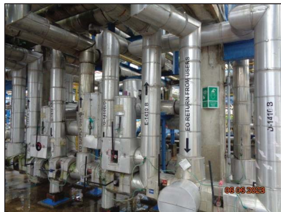
รูปที่ 3.35 อุปกรณ์ที่เกี่ยวข้องกับเอทิลีนออกไซด์ ที่ทำจาก Stainless Steel