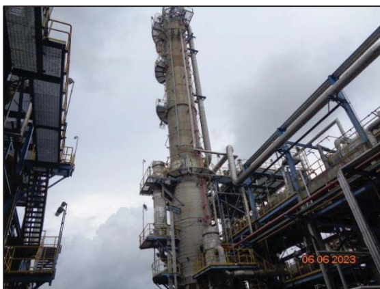
รูปที่ 3.48 ระบบพ่นน้ำลงบนหอกลั่น