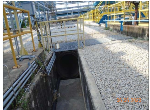
รูปที่ 3.21 Diversion Box