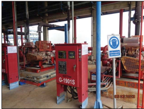
รูปที่ 3.56 เครื่องสูบน้ำดับเพลิง ชนิดเครื่องยนต์ดีเซล