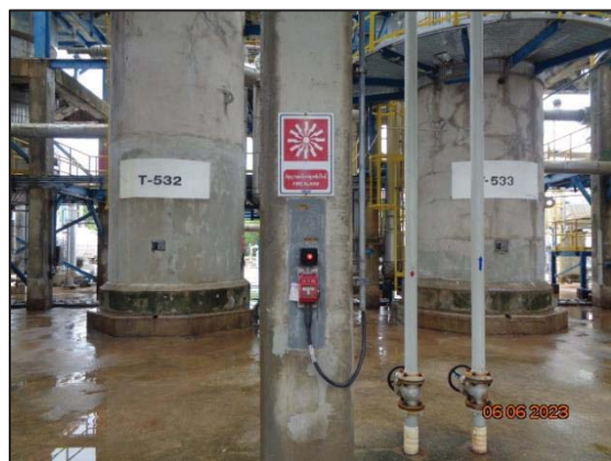
รูปที่ 3.46 Fire Alarm System