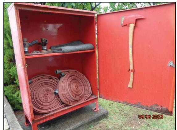
รูปที่ 3.59 ตู้เก็บอุปกรณ์ดับเพลิง