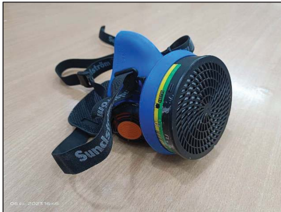
หน้ากากป้องกันสารเคมีเต็มหน้า