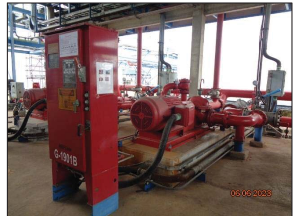
รูปที่ 3.57 เครื่องสูบน้ำดับเพลิง ชนิดไฟฟ้า