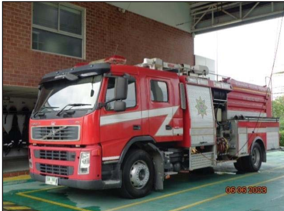
รูปที่ 3.26 รถดับเพลิง (จอดที่ บ. NPC S&E)