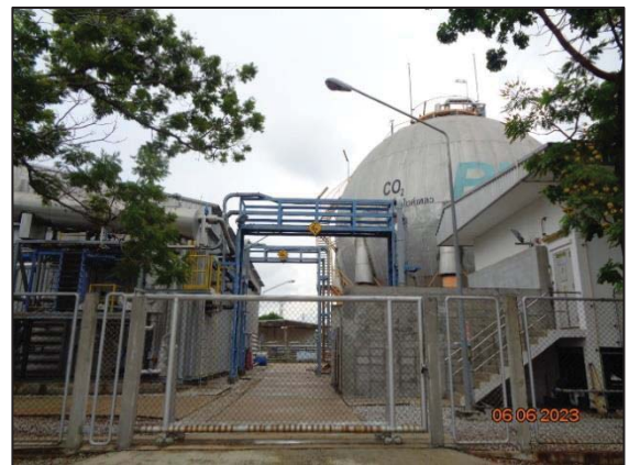
รูปที่ 3.3 Air Separation Plant