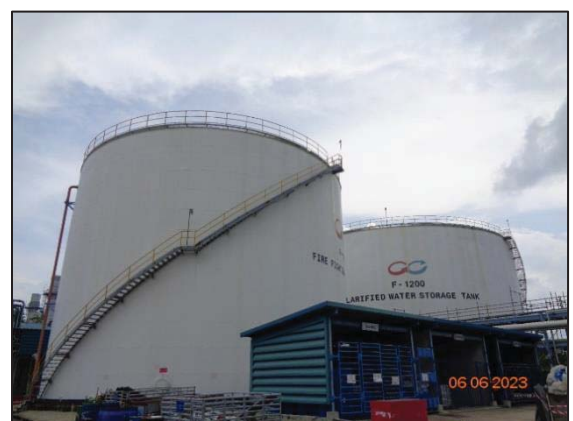
รูปที่ 3.55 ถังน้ำสำหรับดับเพลิง