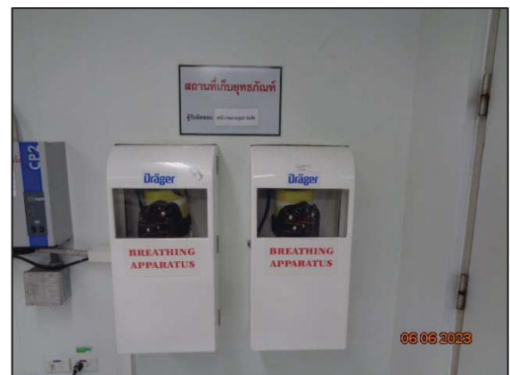
รูปที่ 3.25 Self Contained Breathing Apparatus (SCBA)