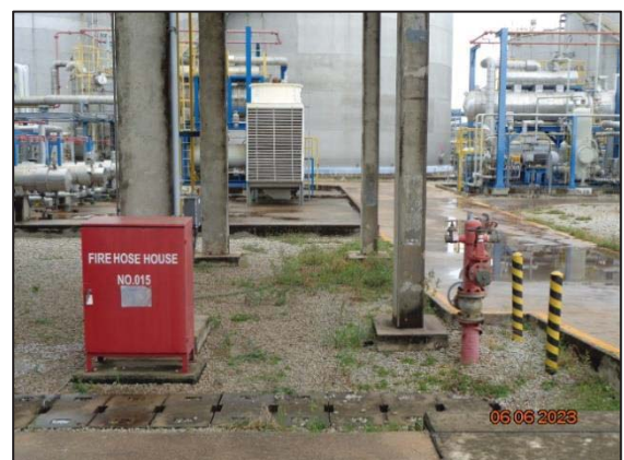
รูปที่ 3.43 Fire Water Monitor