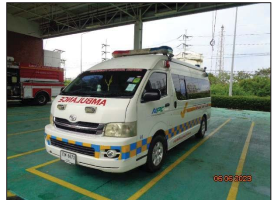
รูปที่ 3.27 รถพยาบาล (จอดที่ บ. NPC S&E)