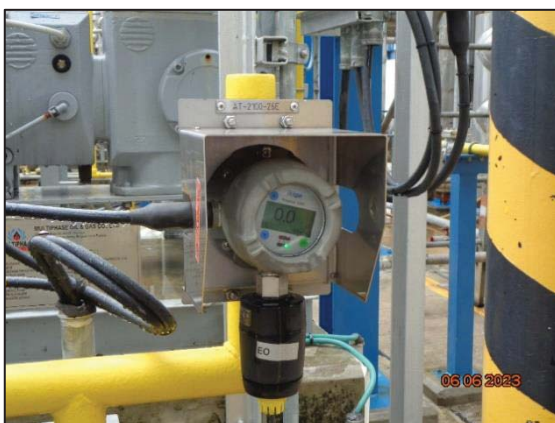
รูปที่ 3.30 เครื่องตรวจวัดก๊าซเอทิลีนออกไซด์