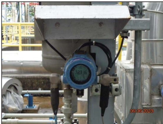
รูปที่ 3.40 Pressure/Temperature Indicator