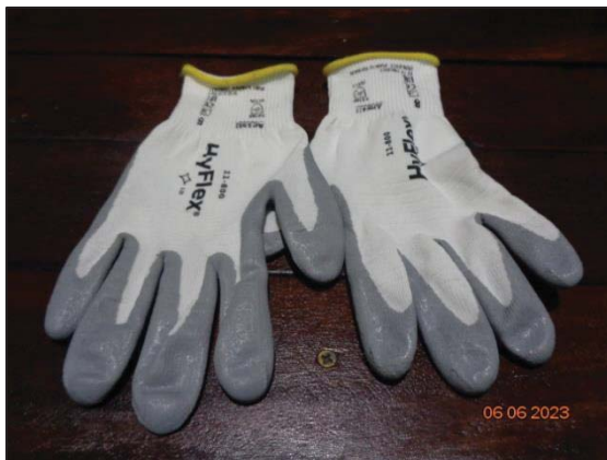
ถุงมือป้องกันสารเคมี