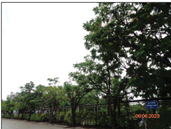
พื้นที่สีเขียวในปัจจุบัน