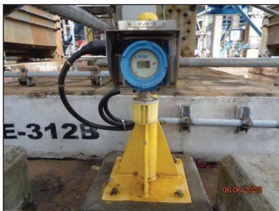
รูปที่ 3.54 Hydrocarbon Gas Detector