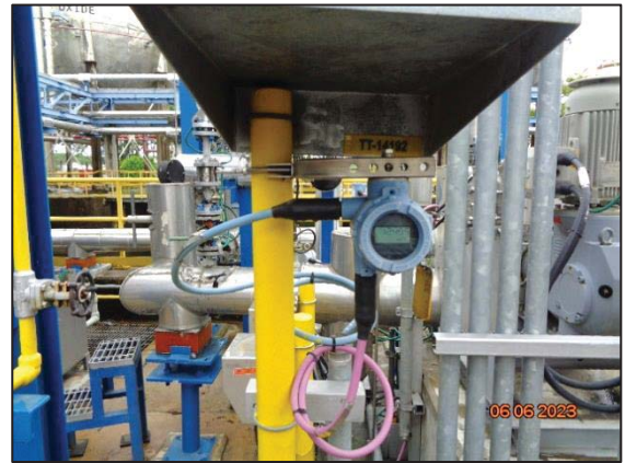
รูปที่ 3.51 High Temperature Interlocks