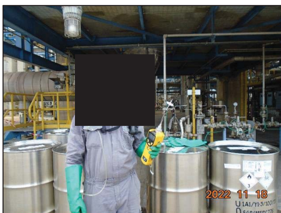
รูปที่ 3.6 การสูบล้างสารเอทิลีนไดคลอไรด์