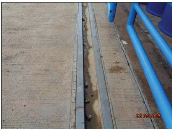
รูปที่ 3.34 ร่องระบายน้ำเพื่อป้องกันสารเคมีรั่วไหล