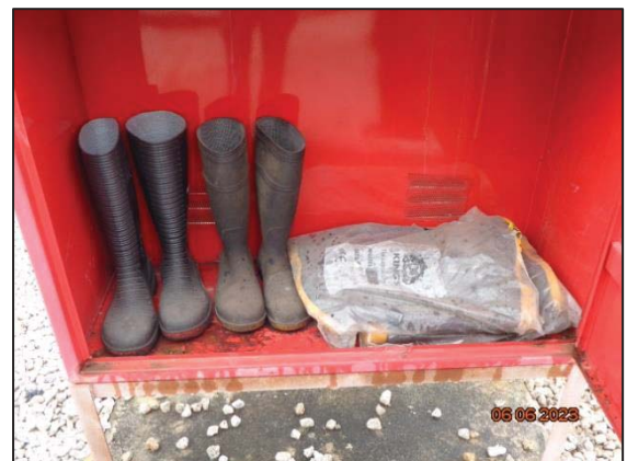
รองเท้าป้องกันสารเคมี