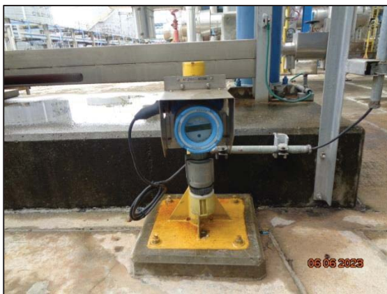
รูปที่ 3.52 Flammable Gas Detector