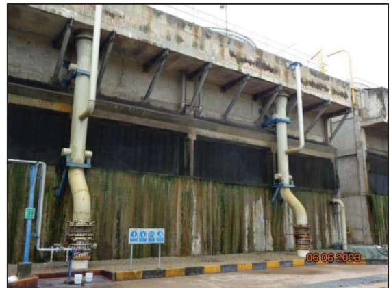
รูปที่ 3.11 Cooling Water Blowdown