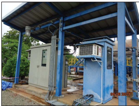
รูปที่ 3.2 CEMS ของปล่อง Waste Heat Boiler