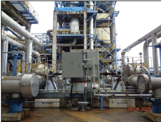
รูปที่ 3.38 ระบบระบายก๊าซ (Relief Valve R-150)