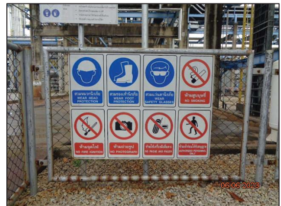
รูปที่ 3.17 ป้ายเตือนอันตราย บริเวณทางเข้า-ออกพื้นที่การผลิต