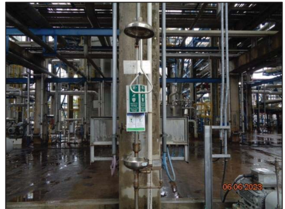
รูปที่ 3.47 Safety Shower