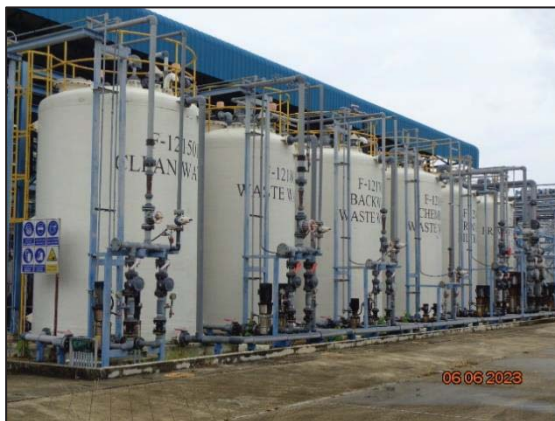
รูปที่ 3.10 หน่วยรีเวอร์สออสโมซิส