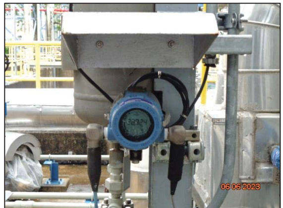
รูปที่ 3.45 เครื่องตรวจวัดอุณหภูมิ บริเวณถังเก็บเอทิลีนออกไซด์