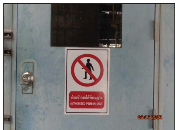
รูปที่ 3.31 บ้ายเตือนไม่ให้ผู้ที่ไม่เกี่ยวข้อง เข้า-ออกโดยไม่ได้รับอนุญาต