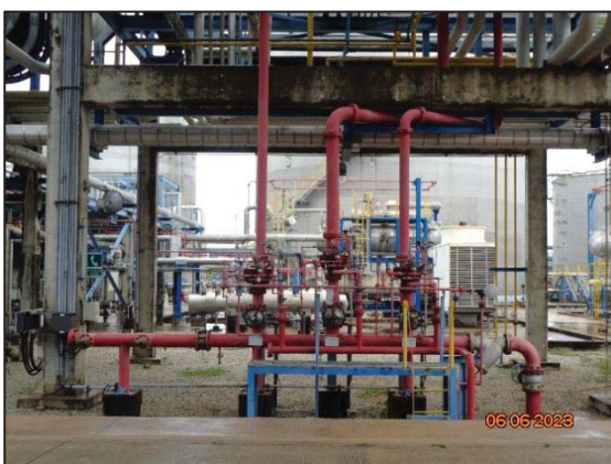
รูปที่ 3.42 Deluge System บริเวณถังเอทิลีนออกไซด์