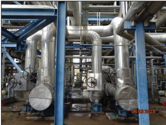
รูปที่ 3.14 Acoustic Insulation (G-624 A/B)