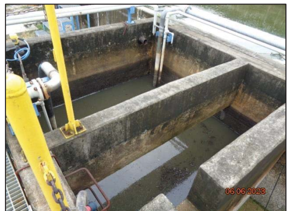
รูปที่ 3.9 Wastewater Holding Pit (F-1801)