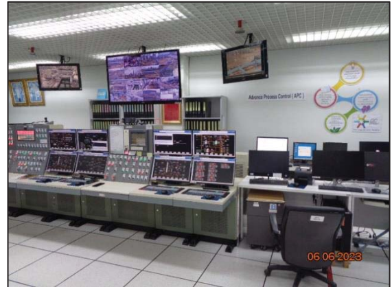
รูปที่ 3.39 ระบบ Distributed Control System (DCS)