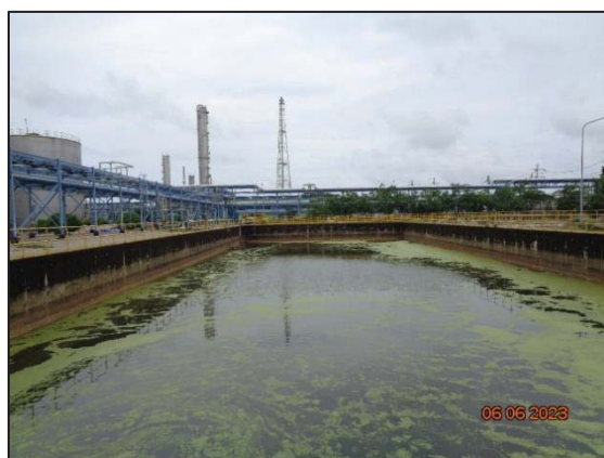
รูปที่ 3.12 Final Check Basin (F-1803)