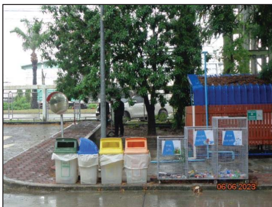
รูปที่ 3.24 ถังขยะแยกประเภท