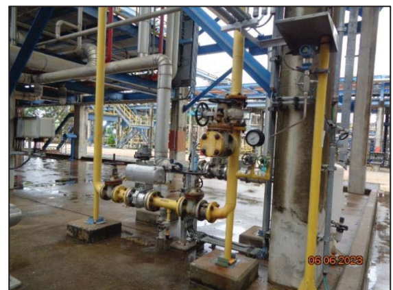
รูปที่ 3.53 Interlocks