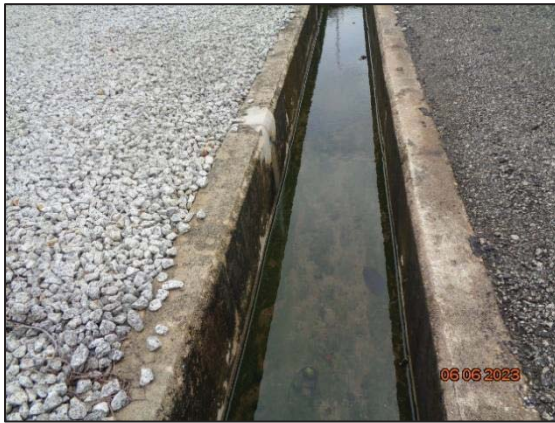
รูปที่ 3.20 รางระบายน้ำฝน