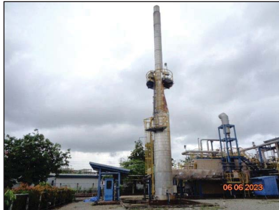
รูปที่ 3.1 Waste Heat Boiler