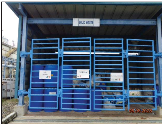
รูปที่ 3.22 อาคารรวบรวมกากของเสีย