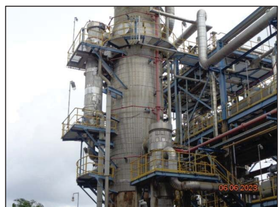
รูปที่ 3.49 Tower Bottom Stream