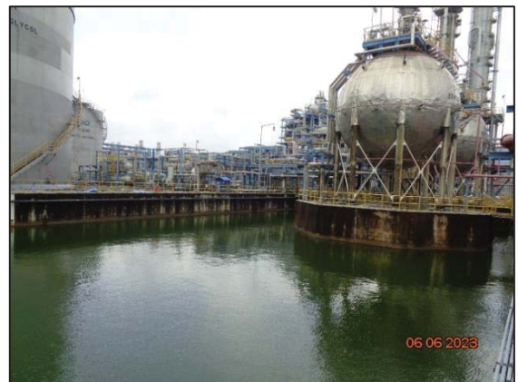
รูปที่ 3.41 EO Dilution Basin