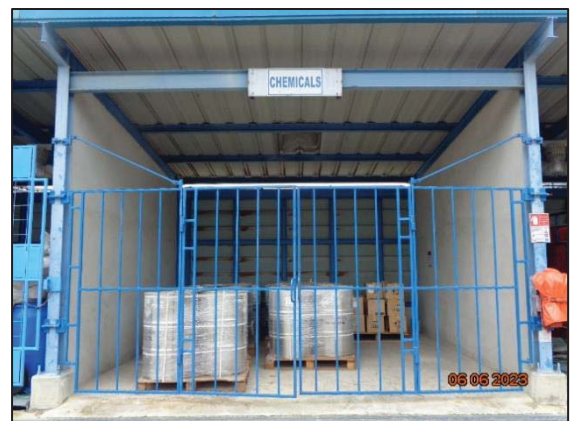
รูปที่ 3.7 อาคารจัดเก็บสารเคมี