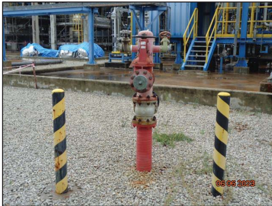
รูปที่ 3.44 Fire Water Hydrant