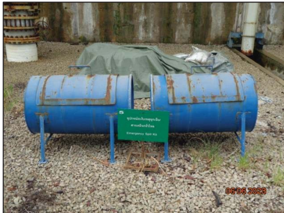
รูปที่ 3.8 ถังทลายดูดซับสารเคมี