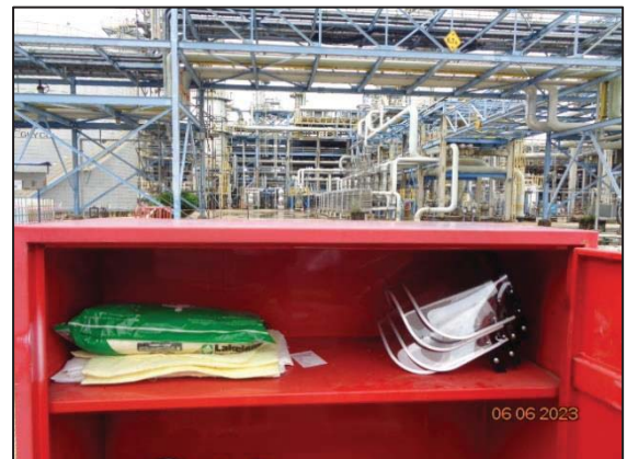
ชุดกันสารเคมีระดับ C