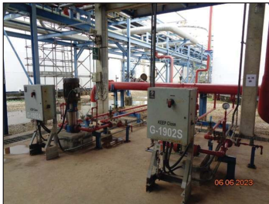
รูปที่ 3.58 เครื่องสูบน้ำดับเพลิงรักษาแรงดัน