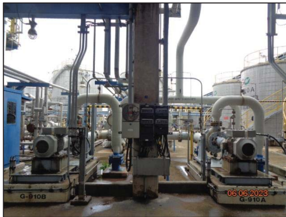
รูปที่ 3.50 Pump ชนิด Double Mechanical Seal