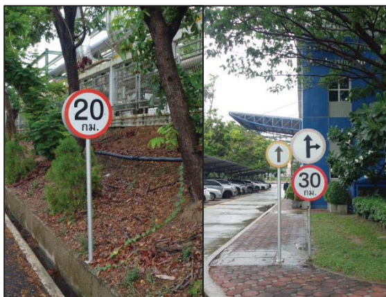
รูปที่ 3.18 ป้ายจำกัดความเร็วยานพาหนะ ในเขตพื้นที่หวงห้าม เช่น Process Area (20 กม./ชม.) และพื้นที่ควบคุม เช่น Warehouse (30 กม./ชม.)