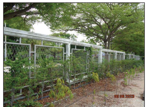
พื้นที่สีเขียวที่ปลูกเพิ่มเติม