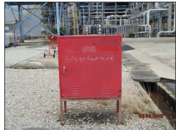
รูปที่ 3.23 ตู้จัดเก็บชุดสารเคมี บริเวณอาคารกักเก็บของเสีย